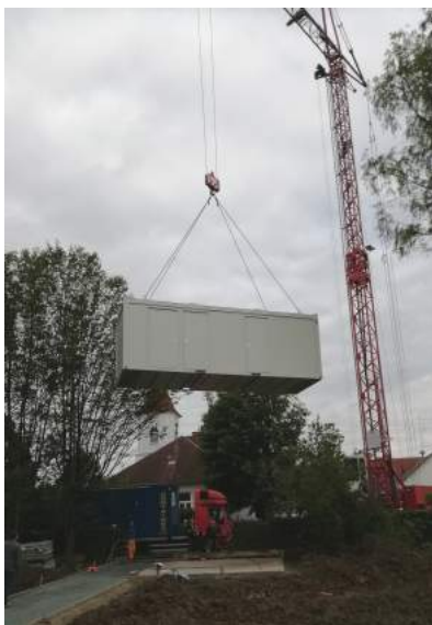
Die WC-Anlage im "Anflug"

So konnte an zwei Wochenenden eine Infrastruktur gestaltet werden, die wirklich wunderschön anzusehen und dazu auch noch sehr funktionell ist.