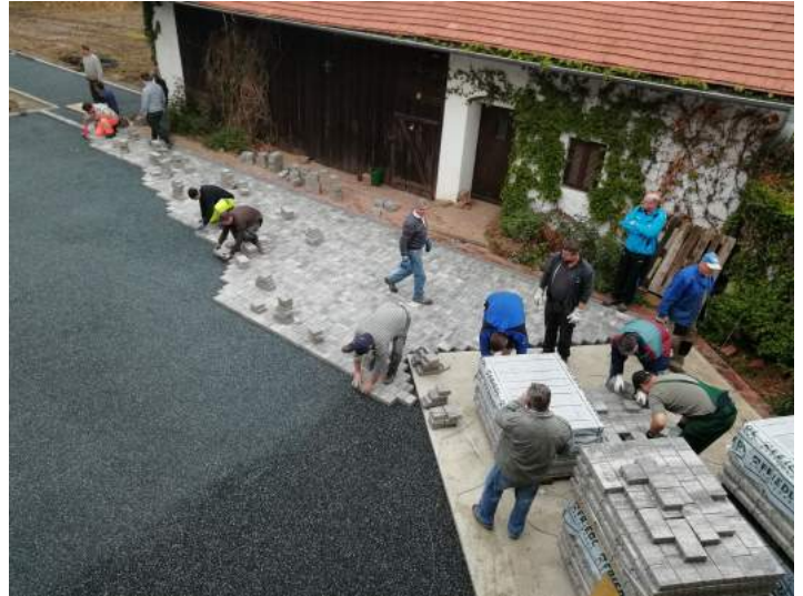
Die Kemeter Vereine und Organisationen packen an ...

Neben diesen baulichen Veränderungen im Innenhof wurde auch eine WC-Anlage errichtet. Dadurch sind jetzt nicht nur die rechtlichen Voraussetzungen zur Abhaltung von Veranstaltungen erfüllt, sondern es wurde auch die Möglichkeit geschaffen, dass Besucher des Parks diese sanitäre Einrichtung mitbenutzen können.